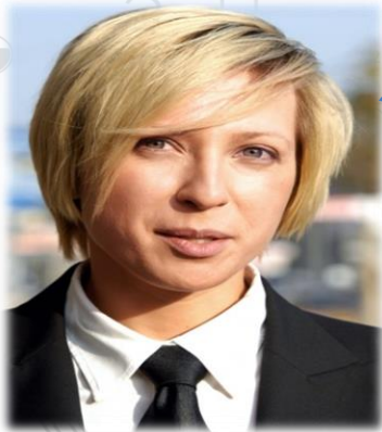
СОПРЕДСЕДАТЕЛЬ Яна Алексеевна Чурикова Российская телеведущая, журналист, автор