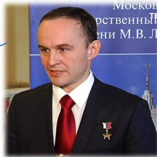
ПРЕДСЕДАТЕЛЬ Сергей Николаевич Рязанский Герой Российской Федерации лётчик-космонавт